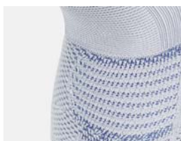
Töjningszon vid underbenet