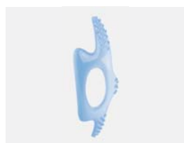
Patellapelott med friktionszoner