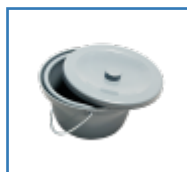
Potta med lock